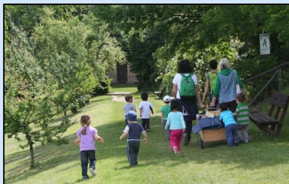
Milano : gli orti nelle scuole