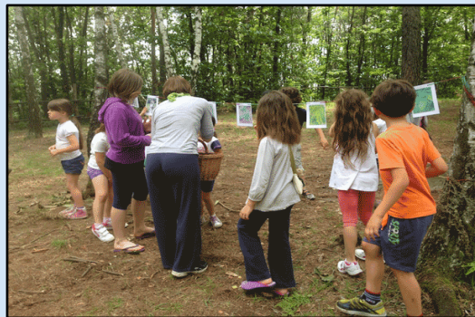
Milano: la scuola nel bosco