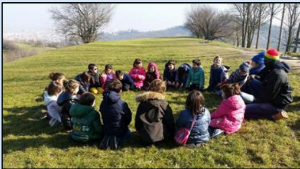
Lucca: didattica all'aperto

Numerosi studi dimostrano come, imparare giocando in un ambiente ricco di opportunità di apprendimento, lontano dalle lezioni frontali e sempre seduti a cui sono abituati i ragazzi crea benessere e sostiene lo sviluppo cognitivo, emotivo, fisico e relazionale