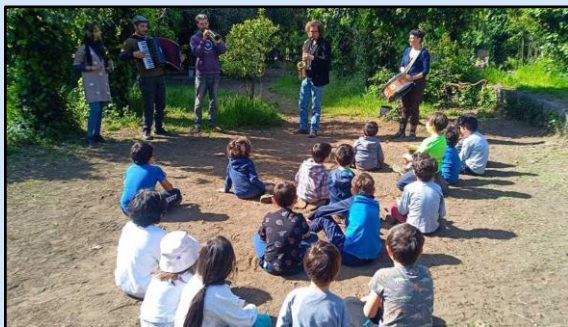
Acireale: la scuola nel bosco